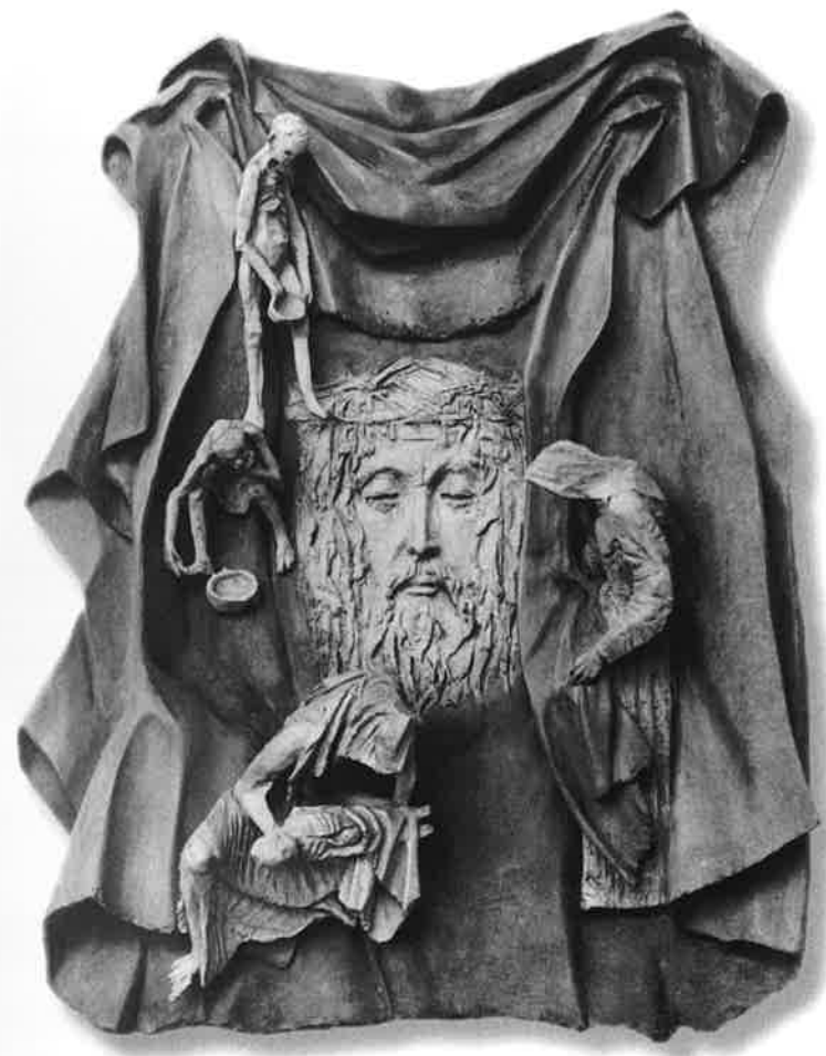
SETKÁNÍ S VERONIKOU (ženy pomáhající nebožákům)

Na každé roušce matky Terezy je otisk tváře Kristovy.