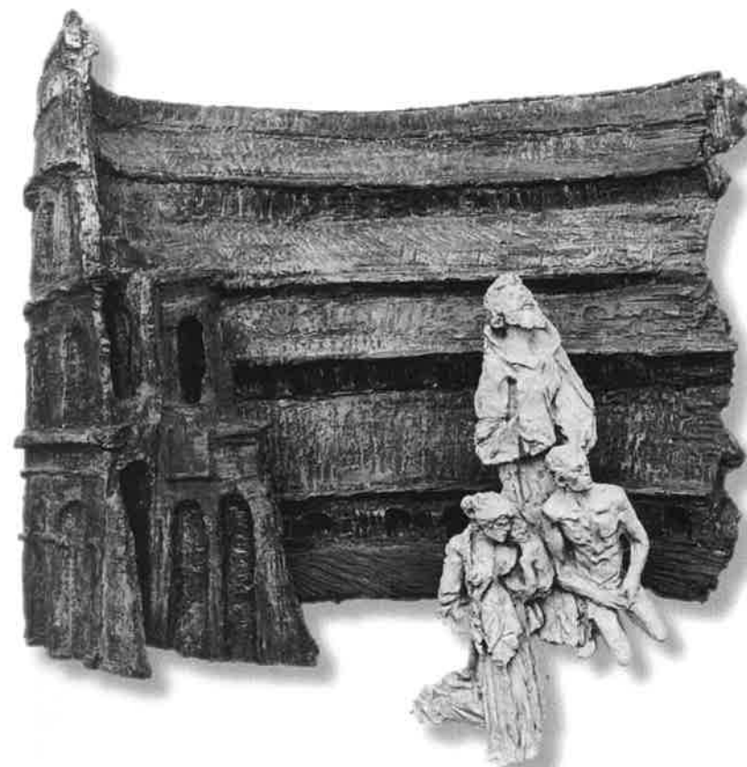
PŘIJETÍ KŘÍŽE ( křesťané v Koloseu )