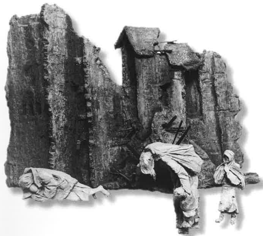
OBNAŽENÍ (vyhořelý domov, válka)

A zatím Bůh dokonává za nás i v nás i námi dílo své.