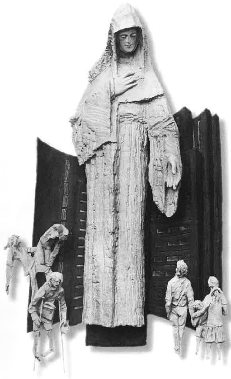
ROZLOUČENÍ S MATKOU ( matka a ztracené děti )

Požehnaný plod života tvého – Ježíš. Třiatřicet let. A kdo dokázal víc milovat odpouštět i obětovat za život sebedelší ?!