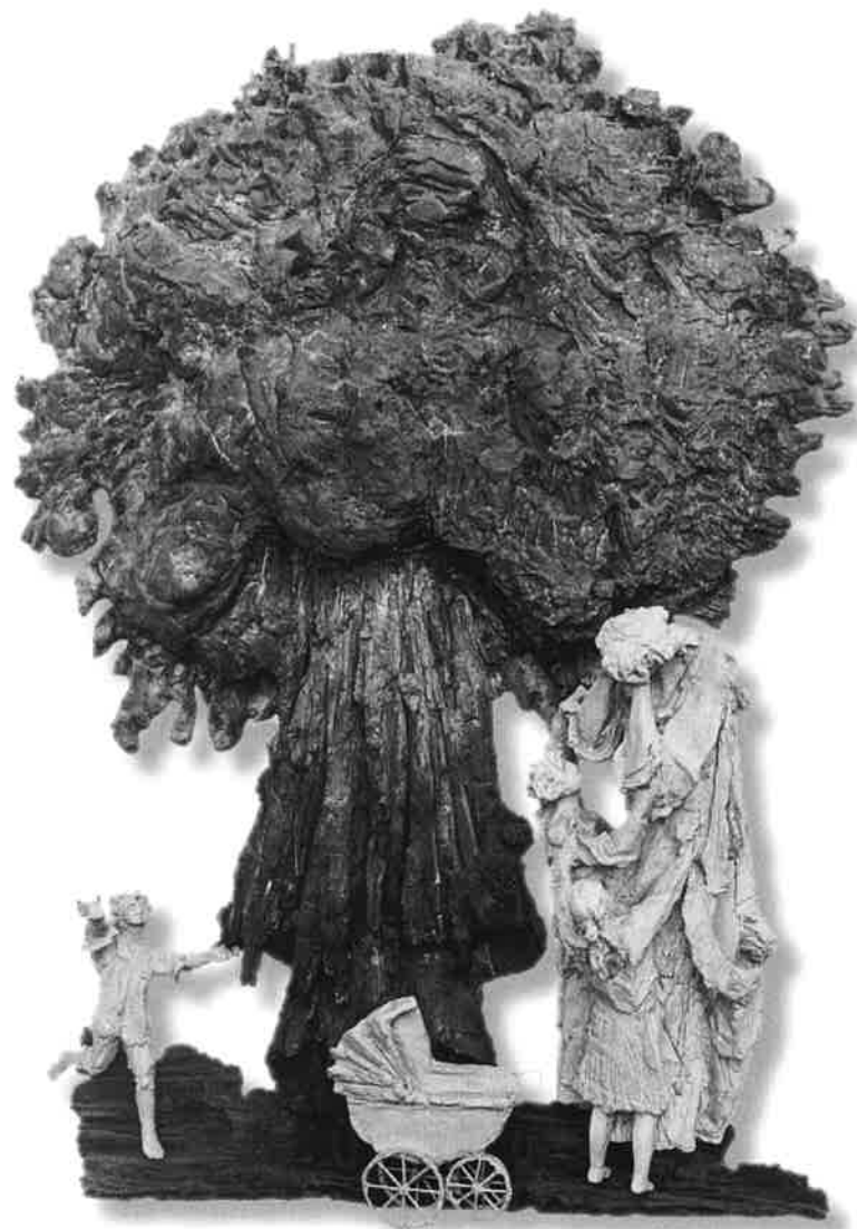
ÚZKOST V GETSEMANECH ( atomový výbuch )