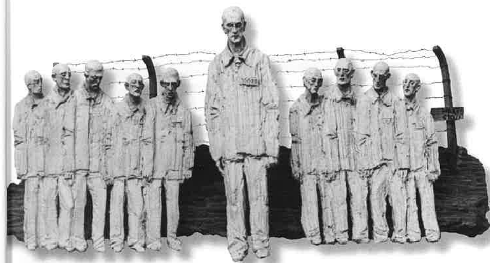
ŠIMON Z KYRÉNY (P. Maxmilián Kolbe)

Vězňové nastoupili na Apell Platz. Z rozkazu Hauptlagerführera se každý desátý odsuzuje k smrti vyhládnutím. Ďábelské rozpočítadlo smrti: Ein zwei drei vier... Zehn těžce dopadlo na otce čtyř dětí. Z řady vystoupil nečekaně Heftling Nummer 16670 Maxmilián Kolbe – kněz. Šimone této Kalvárie. Tys pohotově vzal na sebe kříž svého spoluvězně a začal mlčky kázat evangelium služby a oběti. I lásku lze vyznat číslem.