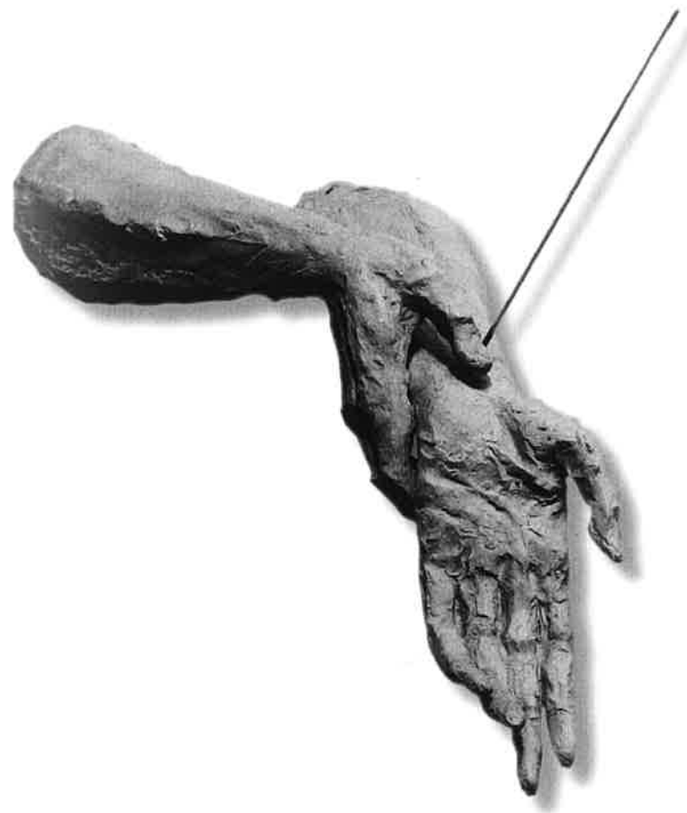
PŘIBITÍ A VZTYČENÍ KŘÍŽE (pokusy vědců provedené na sobě)