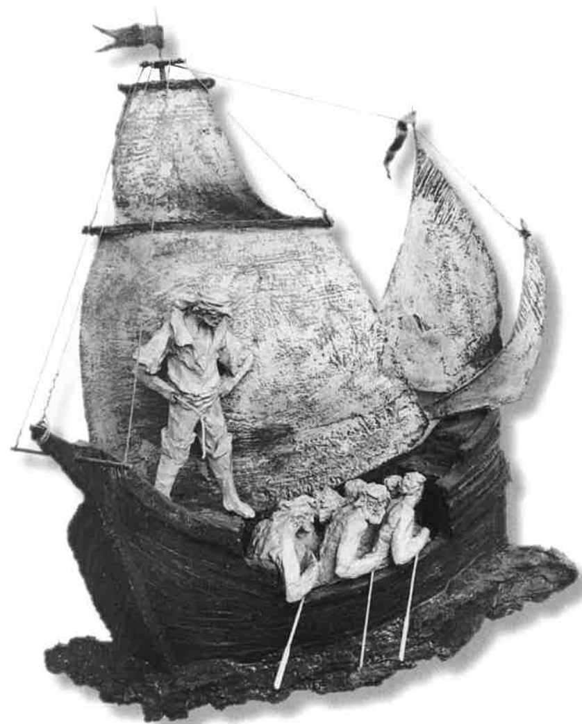
KRISTUS BIČOVÁN ( zajatecká galéra )

Vás koňské síly v podpalubí společnosti vás házené do chřtánu oceánu věků vyproští všemocná ruka Hospodinova. Nesvírá důtky je vám podaná. V ní máte zaslíbení Jonášů. Byť už v nic nevěříte jí uvěřte. A uchopte ji! Z galejí vašich vyvede vás na palubu Božího království před můstek Kapitána který velel i prvnímu plavidlu poslušného a spravedlivého Noeho.