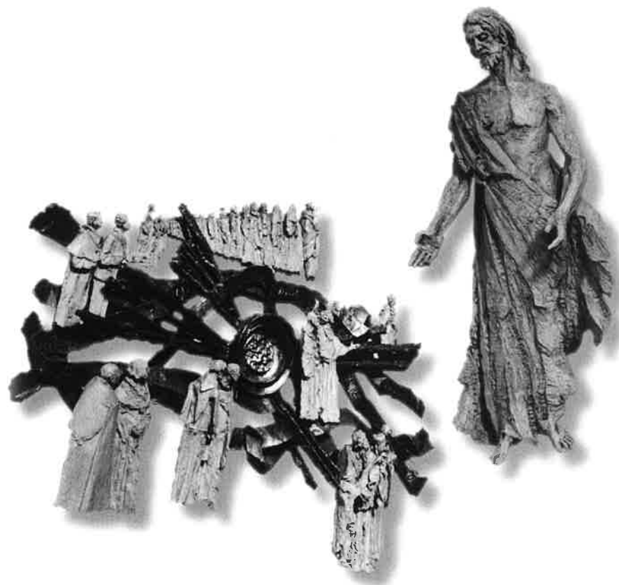
ZMRTVÝCHVSTÁNÍ KRISTA ( slavnost shledání spravedlivých )

Jsme nedůvěřiví Tomáši co sahají si do vlastních ran.