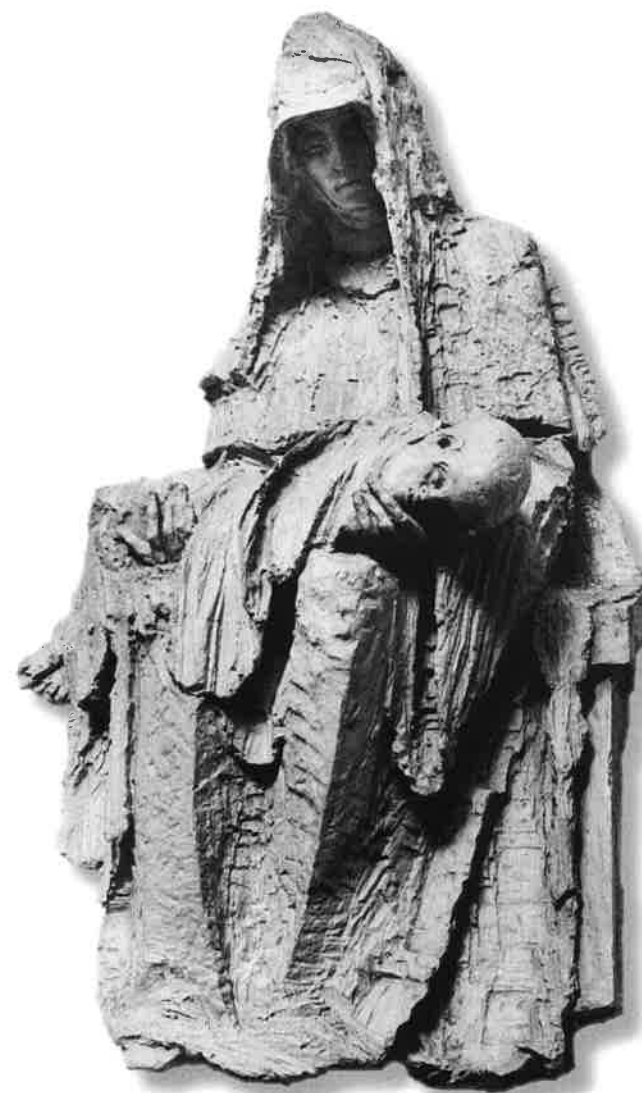
MATKA BOLESTI (s mrtvým dítětem na klíně)

Nebojte se. Nenarodí se vám dnes plenkami obvinuté... Potrat se zdařil. Ježíšikriste!