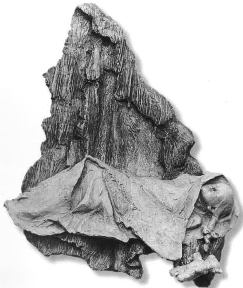
PÁD ( pád dítěte )

Zem ji přijala ve svou náruč. Ta milosrdná matka našich pádů. Slzy země setře hadr na podlahu.